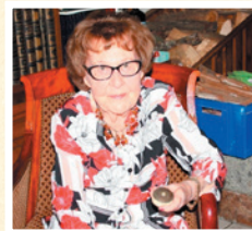
Réalisé en collaboration avec Sylvie Dujj Hélin.

Pourquoi son témoignage est-il important auprès des jeunes comme toi ?