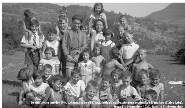
De mai 1943 à janvier 1944, 105 enfants de 4 à 17 ans, seuls ou en fratrie, sont accueillis à la maison d'Izieu (Ain).