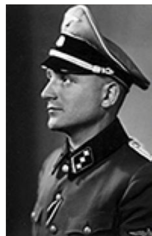
Le lieutenant Klaus Barbie

En 1933, alors qu'Adolf Hitler accède au pouvoir, le jeune Barbie rejoint les Jeunesses hitlériennes , puis adhère au Parti national-socialiste en 1937. Il intègre la SS et la Gestapo , où ses aptitudes pour les interrogatoires et la répression sont rapidement remarquées par sa hiérarchie.